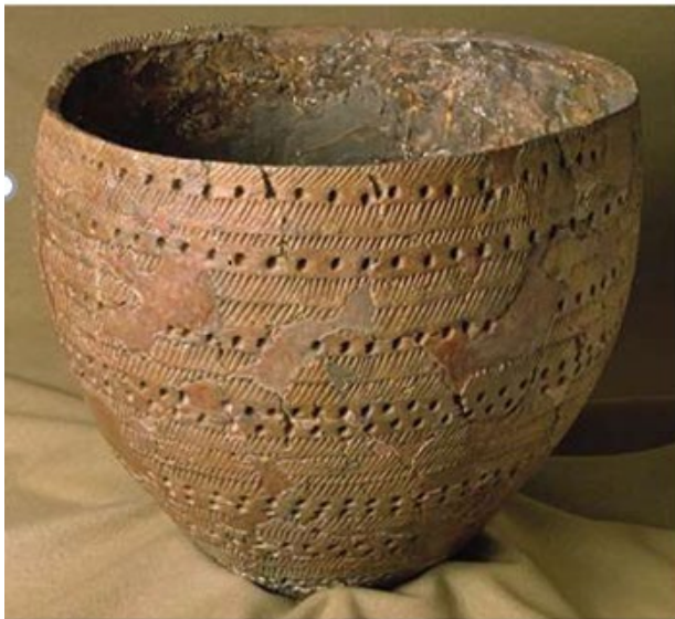
Säämingin Pääskylahdesta löytynyt kamppakeraaminen astia n. 4000-3000 eaa

Vasemmalla oleva saviruukku on kuitenkin parempilaatuinen, vaikka se on tehty aikaisemmin kuin oikealla oleva saviruukku.