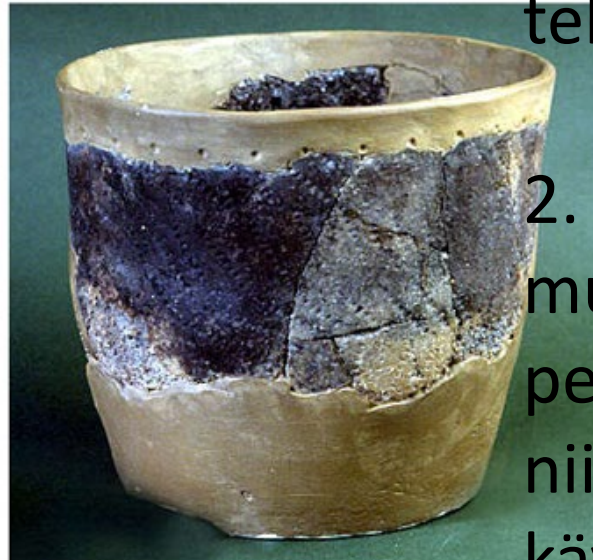
Kiukauskulttuurin aikainen karkeatekoinen, "kukkaruukkumainen" saviastia n. 2000 eaa

1. Miksi kamppakeraaminen astia on parempilaatuinen kuin kiukauskulttuurinen astia, vaikka kamppakeraaminen astia on tehty aikaisemmin?