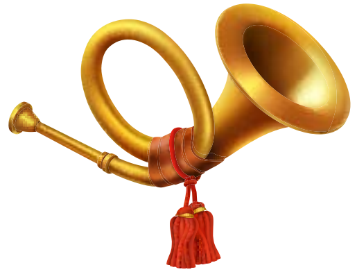
Torvi/metsätorvi soittaa: TEE-TÖÖ, TEE-TÖÖ