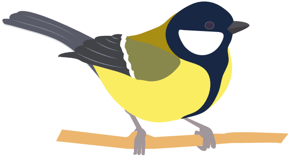
Lintu/talitintti laulaa: TI-TI-TYY, TI-TI-TYY