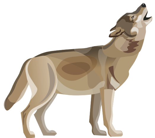
Susi sanoo/ulvoo: UU-OO, UU-OO