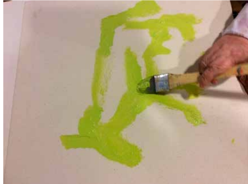
KUVA 2. Kevään värit, eläin- ja luontoteema.

Toisessa työpajassa hoivakodin henkilöstö sadutti ikäihmisiä ystäväkirjan sivuihin ja auttoi heitä valitsemaan lempivärensä värikorteista. Ystäväkirjan valmistuttua opiskelijat päättivät kolmannessa työpajassa yhteisötaideteoksen teeman ja väriskaalan. Lisäksi he suunnittelivat yhteisen maalaustyöpajan sisällön. Yhteisötaideteoksen teemaksi valikoitui suomalainen luonto ja eläimet sekä värimaailmaksi kevään sävyt.