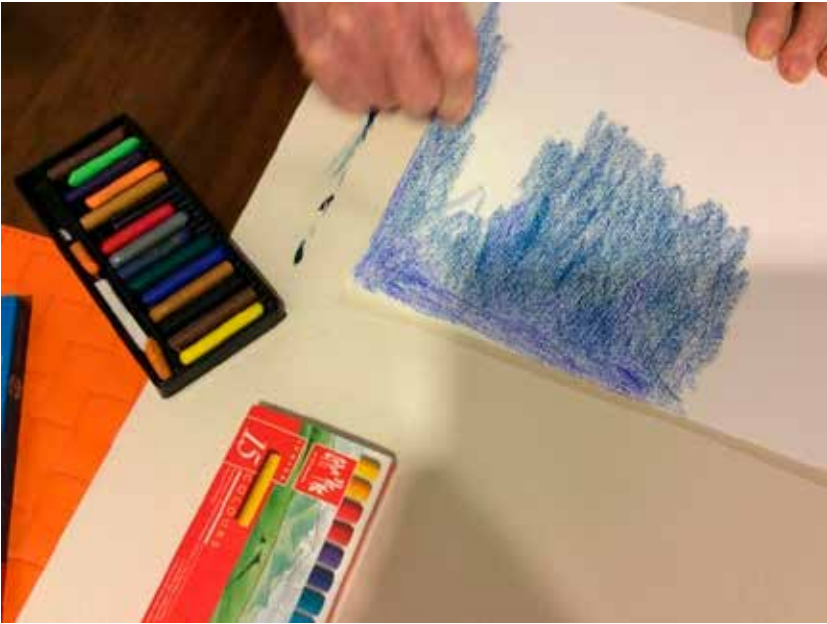
KUVA 3. Maalaustuokiassa käytettiin myös väriliitua.

Neljäs työpaja muodostui ikäihmisten ja opiskelijoiden yhteisestä maalaustuokiosta (kuvat 2 ja 3). Opiskelijat ja ikäihmiset työskentelivät työpareina niin, että opiskelijan tehtävänä oli auttaa ikäihmistä tämän maalatessa taulupohjaa haluamallaan tavalla. Opiskelijat pyrkivät parhaansa mukaan kuuntelemaan ikäihmisten toiveita ja osa opiskelijoista auttoi ideoinnissa, toi maaleja ja keskustelu leppoisasti, kun osa maalasi ikäihmisten toiveiden mukaan tai auttoi työvälineiden hallinnassa.