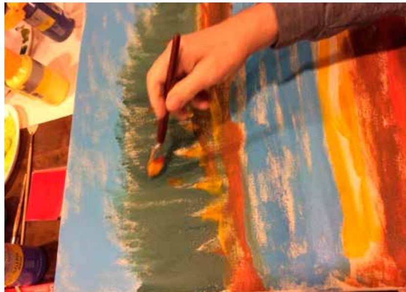
KUVA 5. Asukkaan maalaama järvimaisema-maalauks.

Vihreä talo -maalauksessa yhdistyvät kahden asukkaan teemat siten, että itse vihreä talo on maalattu asukkaan kuvailun ja kertoman mukaan. Kyseessä oli asukas, jota tavattiin hänen huoneessaan, ja hänen kertomansa pohjalta maalattiin taloluonnos ja hänen muistelemiaan kotieläimiä (lampaat). Vihreä talo -maalauksessa jatkuu järvimaisema-teema, sillä järvi jatkuu vihreän talon maalauksen ympäristönä. Asukkaan kuvailun ja kertoman pohjalta toteutettu maalaus syntyi ilahduttamaan asukasta, jolla ei ollut voimavaroja osallistua maalaus sessioon. Kalastusvene-maalauksessa (kuva 6) syntyi vuoropuheluksi maalaus sessio-kohtaamiselle, jossa asukas piirsi sinistä vettä liiduilla. Veselementti oli kalastusta rakastavalle asukkaalle rakas elementti. Tätä kohtaamista muistellen opiskelija maalasi värikkään kalastusveneen keskelle järveä. Kohtaaminen toi taiteidenvälisessä vuorovaikutustilanteessa esille asukkaan kuulluksi tulemisen kokemuksen ja opiskelijan halun jatkaa saman teeman variointia maalausinstallaatioissa.