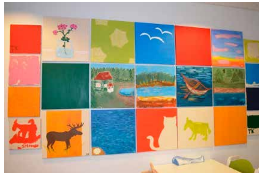
KUVA 4. Ystävän maalaus -yhteisötaideteos.

Ystävänmaalaus koostuu 23 yksittäisestä öljyvärimaalauksesta, joissa ystäväkirja-kartoitusmateriaalin teemat varioivat (kuva 4). Kartoitusmateriaali toimi lähtökohdana asukkaiden toiveiden selvittämisessä ja sen avulla tavoitettiin asukkaiden toive keväisestä värimaailmasta. Kartoitusmateriaalia ja maalausinstallaatiota rinnastava analyysi osoittaa, kuinka yhteisötaideprosessin lopputuloksena syntyneessä maalausinstallaatiossa painottuu suomalaista luontoa peilaava vihreä-sinisävyinen värimaailma, jota raikastavat punaiset ja keltaiset sävyt. Kokonaisuuteen tuo hengittävyttä maalauspuhjen canvas-kankaiden osittainen esille jättäminen. Ystävän maalaus -installaation teemoja analysoitaessa voidaan todeta maalausinstallaatiosta löytyvän erilaisia näkökulma- ja ilmaisuvaihtoehtoja. Kuvallisen vuoropuhelun kehittymiskohtia tarkasteltaessa nousee esille kolme keskeistä ja kehittyvää teemaa: järvimaisema-teeman laajentuminen maalausinstallaation pääteemaksi, eläinteeman varioituminen ja luontoon liittyvät harrastukset.