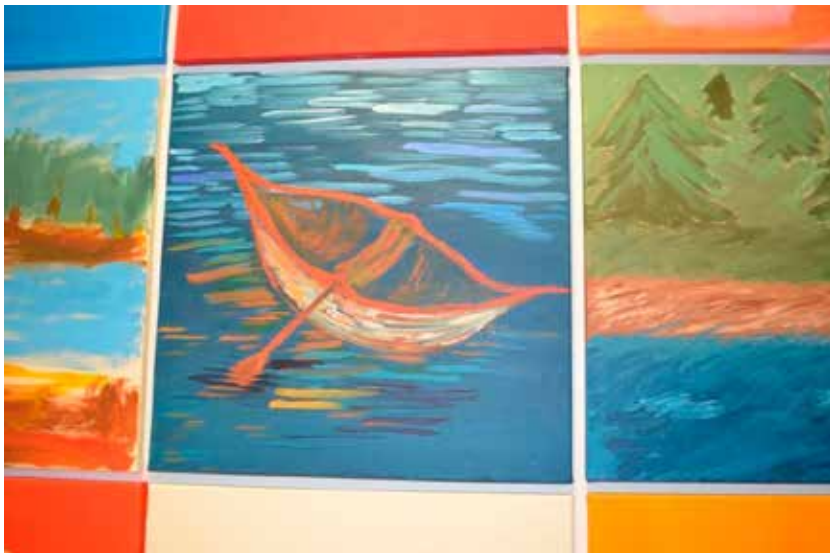
KUVA 6. Nuoren maalaama Kalastusvene-maalauk.

Osa asukkaista maalasi kodin ja pihapiirin eläimiä kuten koiran ja lehmän. Eläimet olivat myös puheen tasolla mukana maalaussessiossa. Kissa-teemaa kehiteltiin maalaussession innoittamana. Yksivärisen vihreän maalauksen tekijä kertoi haluavansa maalata kissan, mutta hänellä ei ollut voimavaroja siihen. Asukasta maalaussessiossa avustanut opiskelija jäi miettimään asiaa ja päätti tehdä omana vuoropuhelumaalauksenaan kissa-teemaisen työn. Hän maalasi kissan negatiivikuvana suhteessa muihin eläinfiguureihin siten, että kissan hahmo rakentui ympärillä olevasta punaisesta taustasta ja itse kissan muoto oli maalaamatonta puuvillacanvas-kangasta (kuva 7).