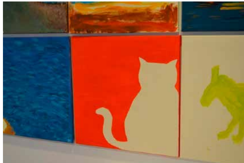
KUVA 7. Nuoren maalaama Kissa-maalauk.

Maalaussessiossa syntyi tunneside näiden kahden maalausinstallaatiota tekevä henkilön välille, ja opiskelija halusi ilahduttaa asukasta kissa-maalauksellaan sekä tuottaa maalausinstallaatioon asukkaan näkökulman. Kohtaaminen toi taiteidenvälisessä vuorovaikutustilanteessa esille asukkaan kuulluksi tulemisen kokemuksen sekä opiskelijan sympatiakokemuksen. Opiskelijan valitsema värivalinta toimi myös vuorovaikutteisessa roolissa. Asukkaan maalaus oli tummanvihreä-vaalea ja opiskelijan maalaus oli vihreän vastaväriin rakentuva eli punavaalea. Vastaväridialogi syntyi siten osallistujien välisestä kuvallista vuoropuhelusta.