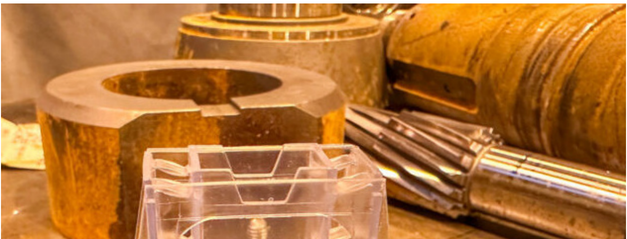
Laserkokeiluja tehtiin Raumalla 10.4.2024.

MALAMA-hankkeen toinen sprintti eli Nopeaa kokeilua lasertekniikkaa hyödyntäen teollisuusympäristössä johdatti meriteollisuusyritykset hieman vaativampiin olosuhteisiin Rauma Marine Constructionin telakkahalliin. Tällä kertaa käytössä oli järeämmät laserlaitteet ja niitä käyttämässä ammatikseen lasertyöstöä tekevät yritykset. Ensimmäinen sprinttihän järjestettiin laboratorio-olosuhteissa, jolloin työstöä tehtiin monikäyttöisillä laserlaitteilla. Suuremmista lasertehoista ja työstönopeuksista huolimatta kohteli lasersäde käsiteltävää materiaalia hellävaraisesti jälkiä jättämättä.