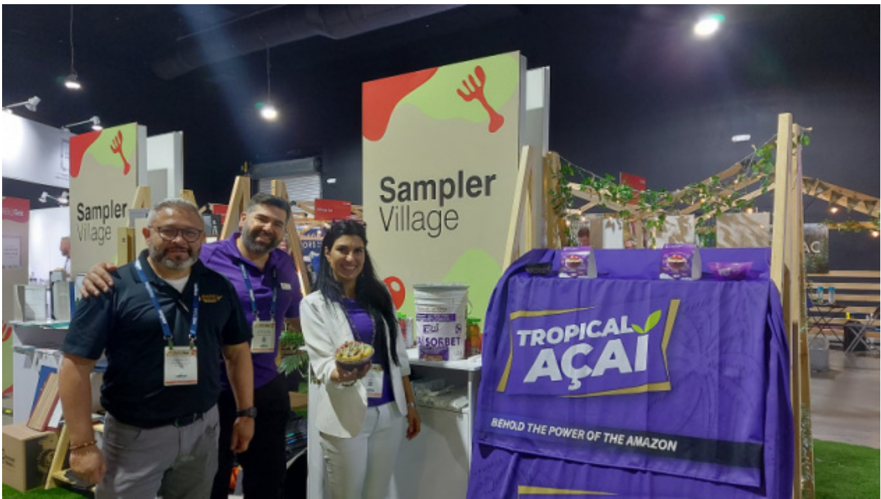
Marjaisa makuelämys.