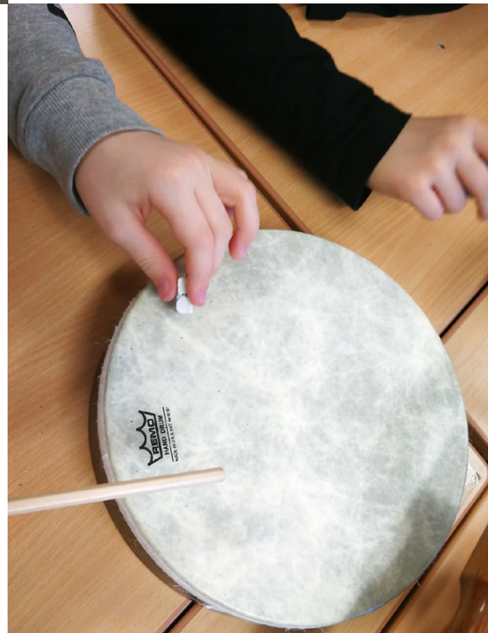
Minä musiikkina -tehtävää testaamassa.

Materiaalin toinen luku soveltuu erityisen hyvin kaikkien oppiaineiden tunnille, sillä sen tehtävät auttavat oppilaita huomaamaan arjen tilanteissa käytettävän kielen ja opiskelun kielen eroja. Keskiössä on lukustrategioiden opettaminen. Osiossa havainnollistetaan monipuolisesti, kuinka oppiainekohtaisen kielen kanssa toimimista voi harjoitella.