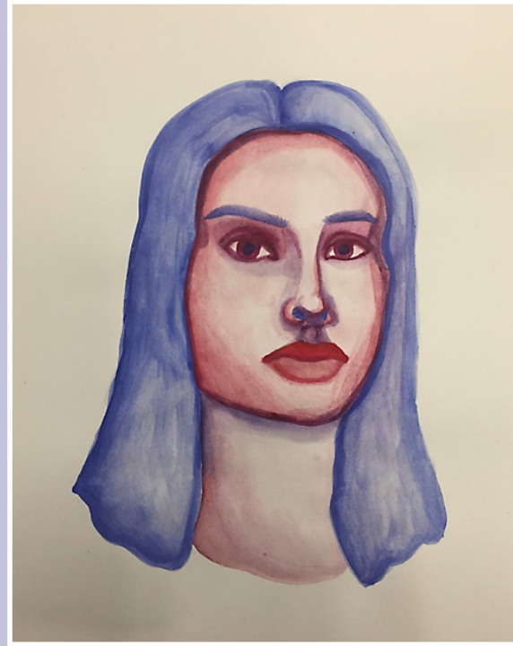
Minä taideteoksena -tehtävän tuotos.

Turun yliopiston kieli- ja kulttuuritietoisen opetuksen tiimi yhteistyökumppaneineen kehittää uutta kieleen ja kulttuuri-identiteettiin keskittyvää oppimateriaalia peruskouluun. Materiaali sopii kaikille opettajille ja kaikkiin luokkiin, mutta kielellisen ja kulttuurisen moninaisuuden asiantuntijoina suomen kielen opettajat ovat avainasemassa materiaalin levittämisessä koko koulun käyttöön. Oppimateriaali julkaistaan tulevana syksynä maksutta osoitteessa www.utu.fi/minasta-ja-kielesta-kiinni .