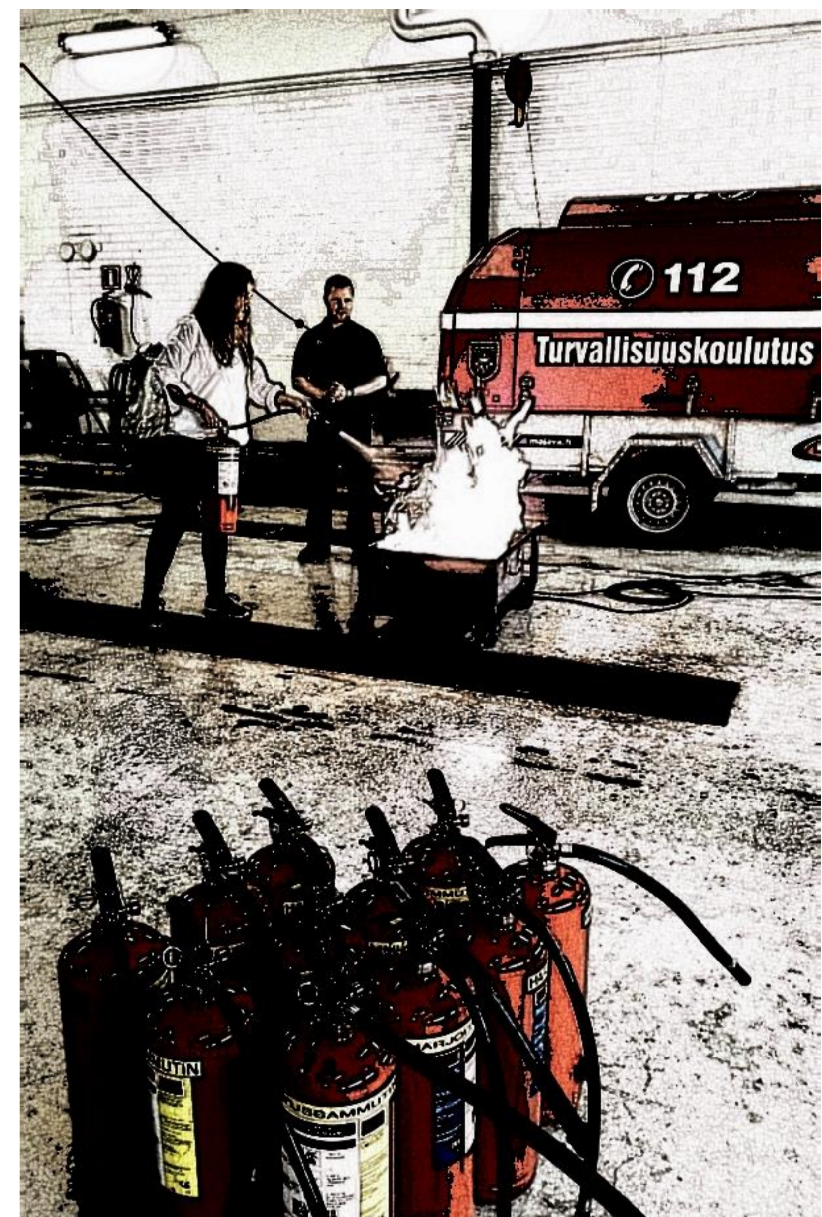
Alkusammutusharjoitus Rauman paloasemalla.

Turvallisuusasiat unohtuvat helposti! Muista kerrata!