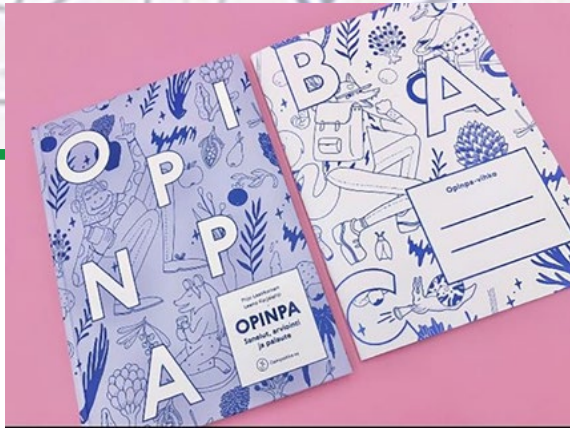
Opinpa – Sanelut arviointi ja palaute sekä Opinpa-vihko.

Suomessa on käytössä monia lukitestejä ja arviointivälineitä (ks. Vitka 2021, 131–133). Osa näistä testeistä ja kokeista on myös normeerattuja, jolloin opettaja voi arvioida oppilaiden osaamisen suhteessa ikäluokan tulokseen. Monet arviointivälineistä ovat moniosaisia ja pitkiä. Ne auttavat löytämään oppimisvaikeuksien syitä. Opettajat kuitenkin tarvitsevat käyttäjystävällisiä lukusujuvuuden arviointivälineitä, joiden antamaa tietoa voidaan käyttää suoraan tukemaan oppilaiden oppimista. Käyttämäni lukusujuvuuden arviointiväline on yksinkertainen ja lyhyt, mutta sen antama tulos on riittänyt tunnistamaan tukea tarvitsevat oppilaat koulusamme. Tuloksista on voitu muodostaa myös oppimistavoitteet ja tukimuodot. Ja koska arviointi on jatkunut läpi alakoulun, voidaan nähdä myös