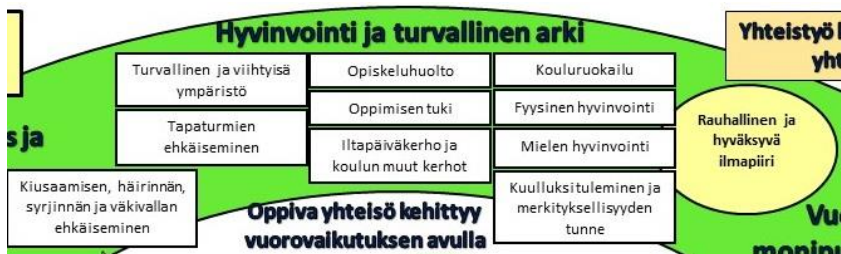
Ote Toimintakulttuuri – kuvasta luvusta 4:

Toimintakulttuurikuvassa Hyvinvointi ja turvallinen arki- osiossa on myös kouluruokailu ja iltapäiväkerho ja koulun muut kerhot.