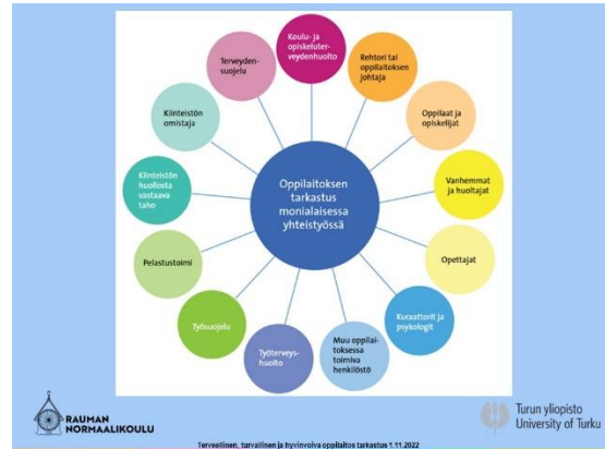
Kuvio THL:n ohjeista

Tarkastuspöytäkirja laaditaan THL:n lomakkeelle ja tarkastetaan osallistujien kesken (sähköpostijakelu) ennen virallista allekirjoitusta ja jakelua. Toimenpiteiden seurannasta vastaa rehtori yhdessä opiskeluhoitoryhmän ja turvallisuusryhmän kanssa. Tiedotus eri tahoille hoidetaan THL:n ohjeistuksen mukaan.