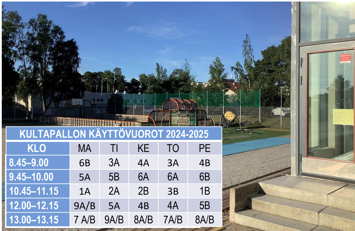
KULTAPALLON KÄYTTÖVUOROT 2024-2025