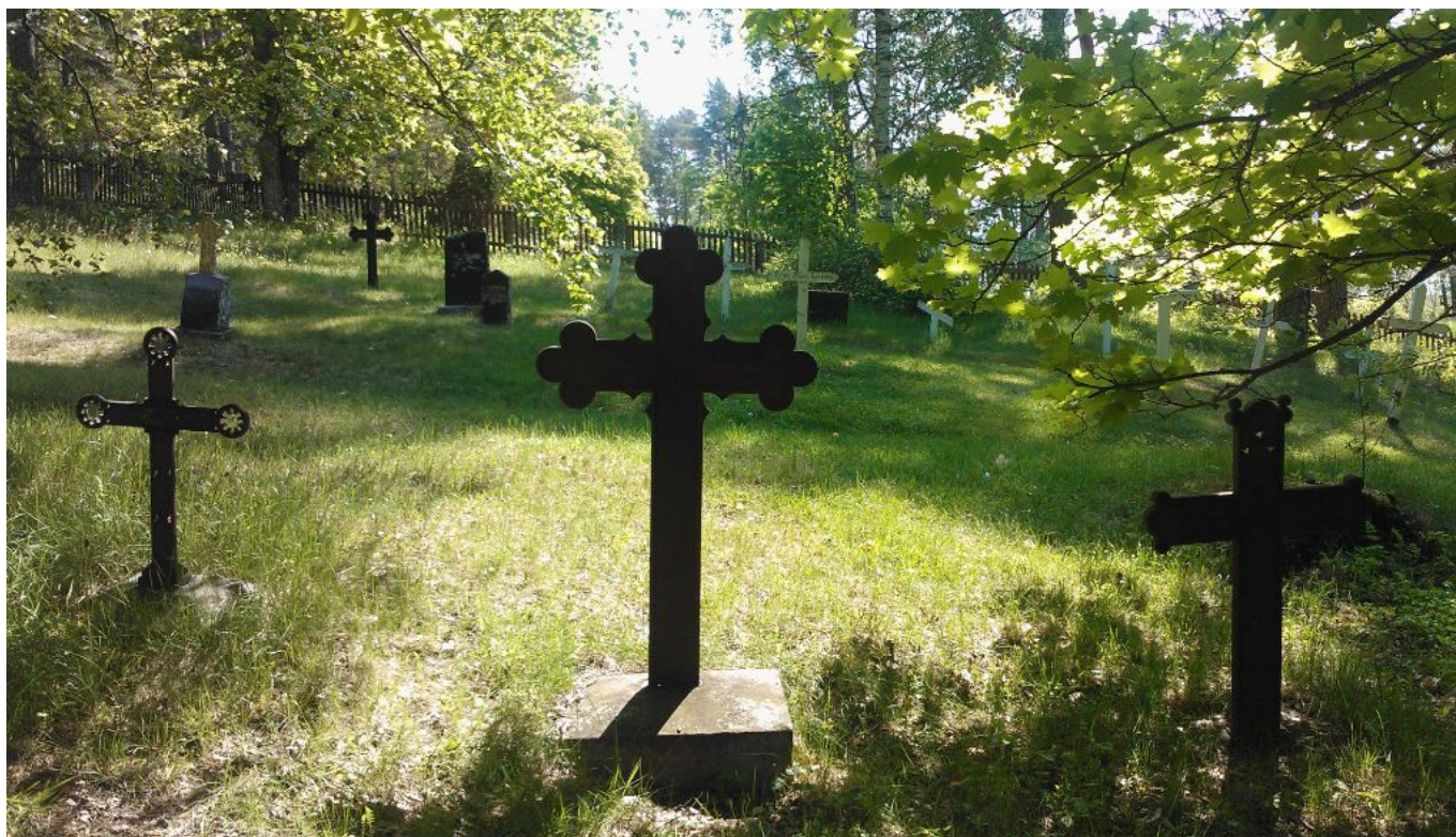
Herra v. K:n hautamuistomerkki löytyy kuitenkin henkilökunnan ja saarelaisten puolelta. Sen merkinä ovat kiviset ja rautaiset muistomerkit hautausmaan länsipuoliskossa. Mielisairaalan potilaiden vaatimattomat puiset ristit ovat yleensä itäpuolella ja ne ovat suurelta osin jo hävinneet.

lisiko lehdessä julkaistu köyhän ja tuntemattoman potilaan tarinaa. Kaiken kaikkiaan ylempisäätyisten päätyminen Seiliin esitetään muita traagisempaan tapauksena, ikään kuin mennyt loisto tekisi sairaudesta entistäkin kurjempaa – ja siten mielen-