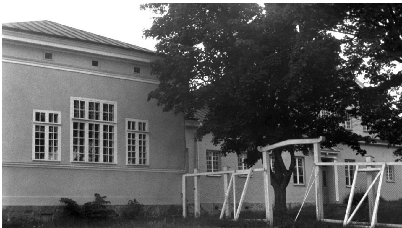
Päärakennuksen pohjoispuolella ollut kävelypiha oli aidattu rautalangalla. 1960-luvun alussa kävelypihan portit oli jo nostettu irti, ja laitokselle haettiin uusia käyttäjiä. Turun yliopisto aloitti saarella tutkimuslaitostoiminnan 1964.

Aineistoista erottuvat selkeimmin potilaiden kärsimyksen herättämät ahdistuneet tunteet. Mielisairauden leimaamaa elämää eristetyissä, ankeissa oloissa pidetään lohduttomana. Sairaalan näkeminen tai kuvittelemisen saa monen kirjoittajan spekuloidaan potilaiden kokemaa tuskaa ja kärsimystä. Emootioiden sosiaalisuutta korostavan Ahmedin (2004) mukaan tuska tehdäänkin näkyväksi juuri julkisissa yhteyksissä, vaikka sitä perinteisesti on pidetty äärimmäisen yksityisenä kokemuksena.