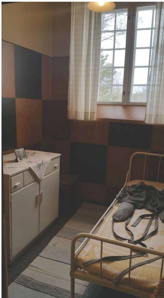
Museuhuone nykyisessä asussaan Turun yliopiston Saaristomeren tutkimuslaitoksella on sisustettu 1960-luvun lääkintöhallituksen määräysten mukaisilla valkoisiksi maalatuilla huonekaluilla. Seinät sensijaan on konservoitu alkuperäisen mukaisiksi.

Barometern, Uusi Suometar, Åbo Tidning, Helsingfors Dagblad sekä Nya Pressen olivat kaikki tärkeitä, laajalevikkisiä lehtiä, jotka tavoittivat paitsi tavallisia kansalaisia, myös korkeissa, vaikuttavissa asemissa olevia ihmisiä. Mutta voiko niissä esitetyistä kriitikoista tehdä päätelmiä häpeän ja kansallistunteen luomisen kytköksistä? Vaikka kansan yhdistäminen tuskin onkaan ollut kirjoittajien tietoisena tavoitteena, se on voinut vaikuttaa taustalla heidän ottaessaan esille maan ensimmäisen valtiollisen mielisairaalan epäkohtia. Vaatimus potilaiden humanista kohtelusta liitetäänkin teksteissä usein sanoihin ”maamme” ja ”sinä” (lukija, kansalainen): sairaalan puutteet ovat häpeäksi koko maalle ja joh-