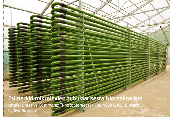
Esimerkki mikrolevien tubulaarisesta bioreaktorista

Mikrolevien bioreaktori voidaan asettaa lähes minne vain, joten se ei vie perinteisiltä viljelykasveilta kasvupinta-alaa.