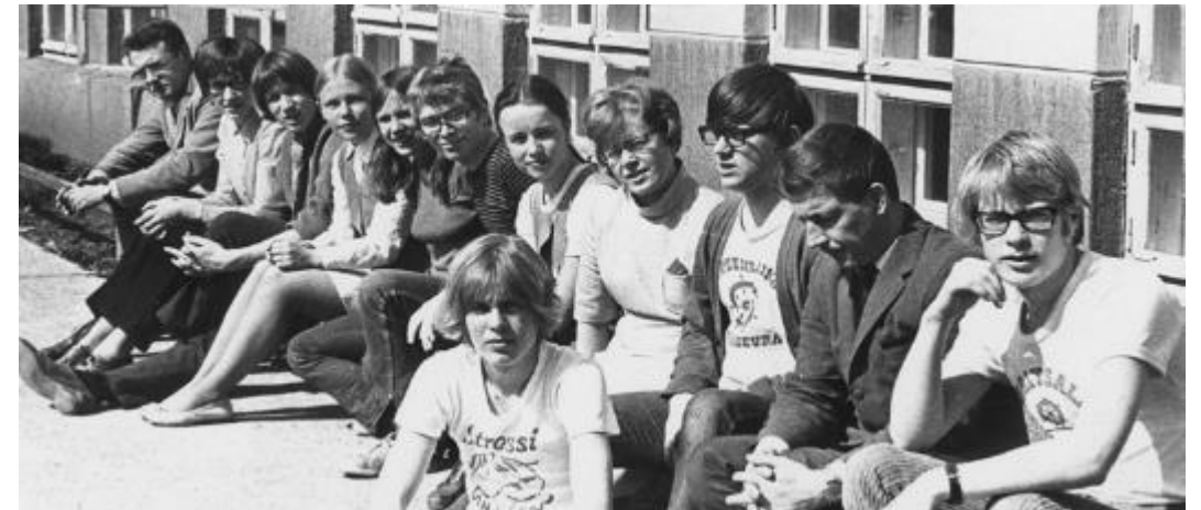
Kuva: Lauritsalan yhteiskoulun teinikunnan hallitus 1969-70.