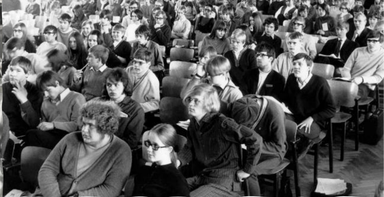
Kuvat: Teiniliiton kesäkurssi n. 1960, Esa Peltosen kokoelma; Teiniliiton liittokokous 1969, Kansan Arkisto.