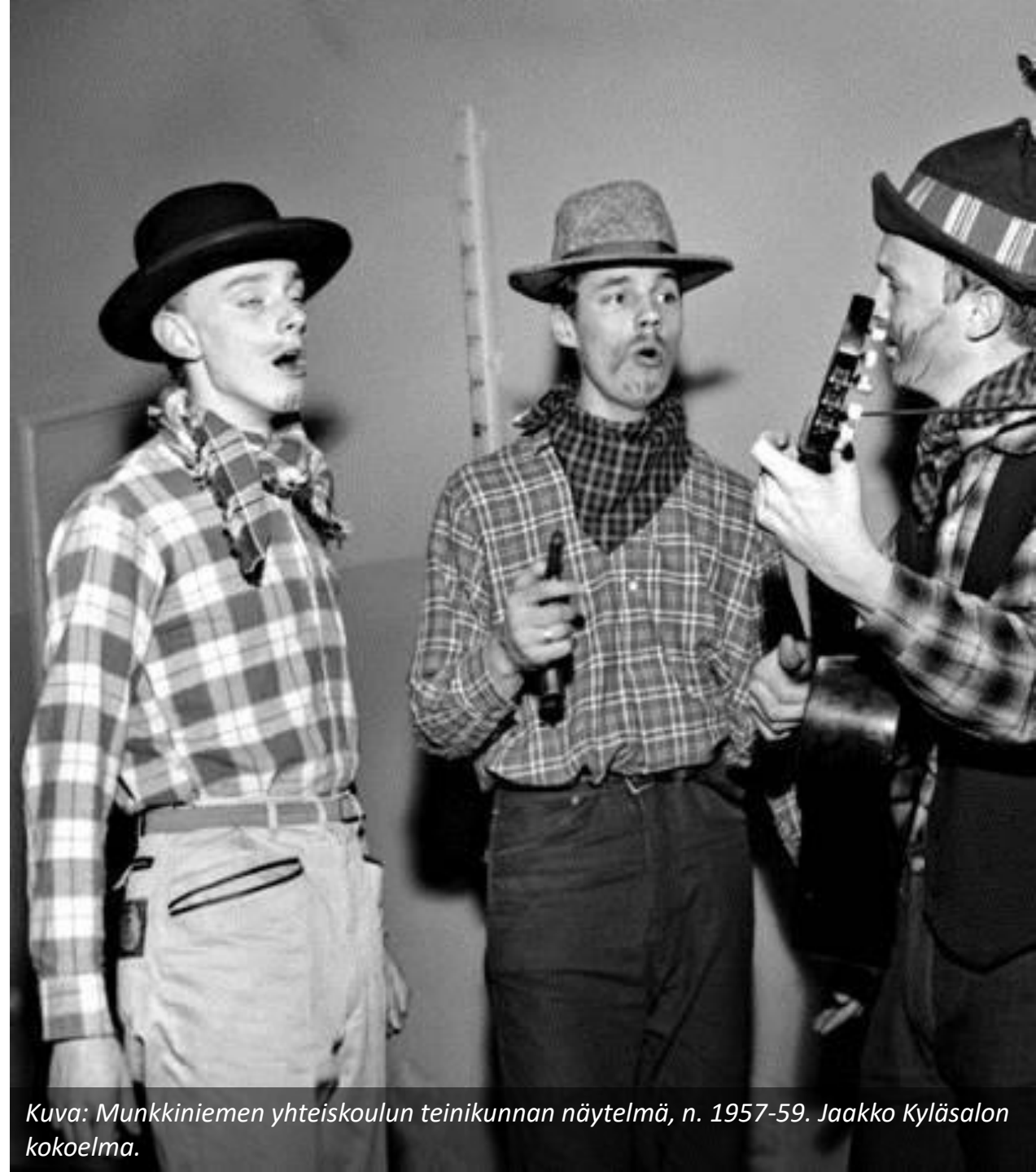
Kuva: Munkkiniemen yhteiskoulun teinikunnan näytelmä, n. 1957-59.