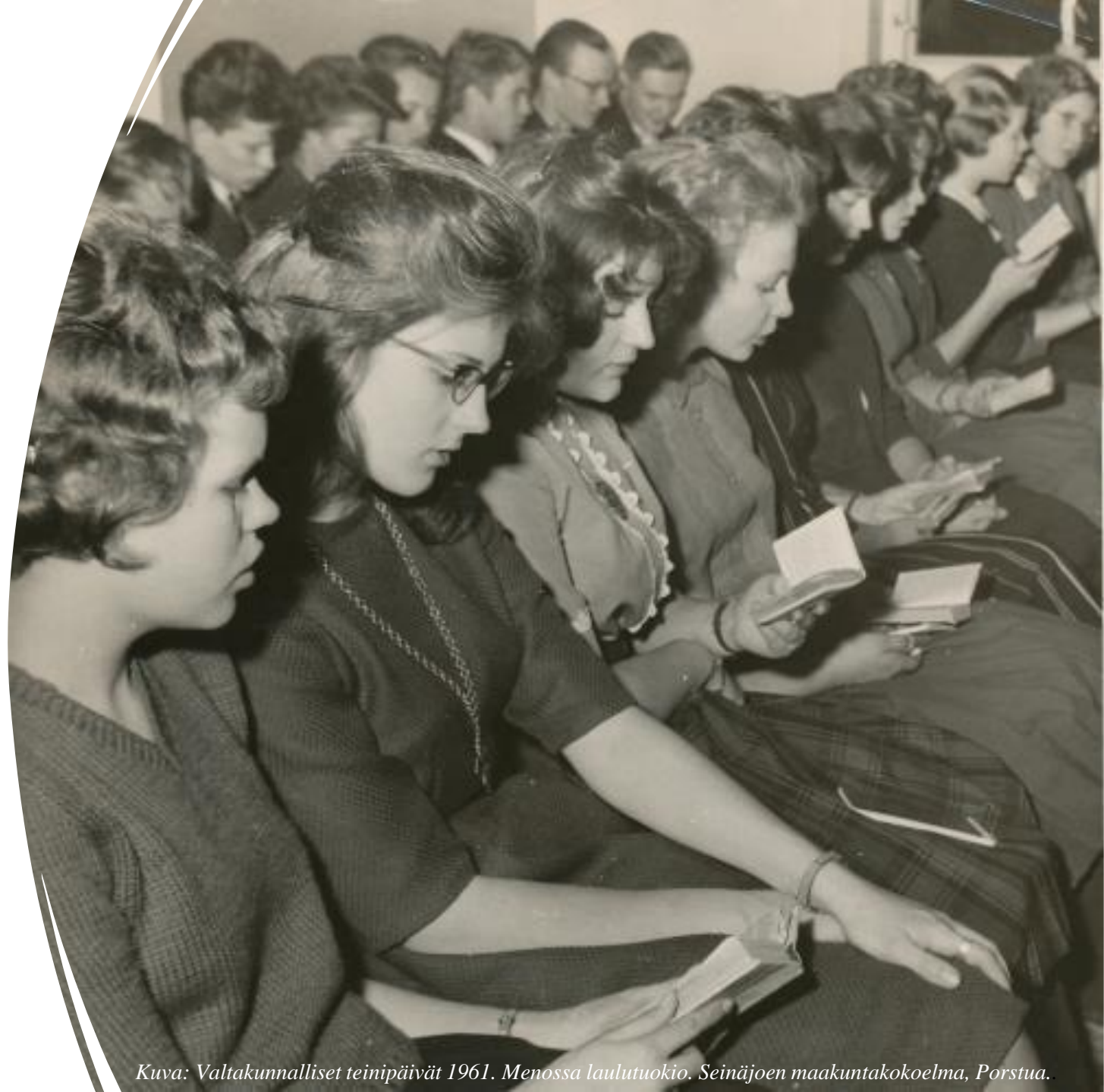
Kuva: Valtakunnalliset teinipäivät 1961. Menossa laulutuokio.