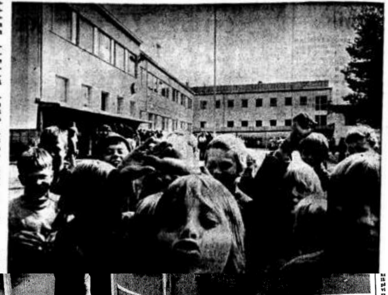
Kaleva 18.2.1973 ja 21.2.1973

Talteen miehestä pitkä askel pimeään, toisen miehestä askel harppaus kohti edistystä otetaan ensi tuntiin, kun oppikouluunsa suorittaneista etalouksalaisista harras elikköön kynnökseen olevaan vanhimpaan lehtoriin ja rehtoriin käy uurella vaihtamaan tielle kouluneuvostoja. Ensi torstaina koulujen Ensi-tuntiaulla jo juhli- taan ketä yhä monta oppilasta ja opettajaa kätän- vässä kouluneuvostossa ryhtyvät laatimaan koulun järjestyskäsikirja, raskaisessaan, kehittämään ja yhte- näistämään koulun opetusta ja kasvatusta, suunnite- maan koulunosaalista toimintaa ja muita muuta vielä tarkemmin määrittelykäsikirjaksi tehtäväksi. Ensimmäisin kouluneuvostoihin valittiin 48 200 jä- sentä: kouluja on hiukan yli 500. Jäsenistä 1 000 on opettajia ja samaa verran oppilaita. Lisäksi neuvostot saavat 1 500 puhevalian muista ei äänestyskelpoista omaansa apujäseniä. Neljässä koulussa viidestä jäsenet valitaan kieltä- peräisesti mukaan, niin, että opettajat valitsevat omat edustajansa, oppilaat omansa. Vain 94 koulussa päätettiin ristiliikennyksessä, jolloin kumpikin ryhmä pääsee val- kuttamaan toisen edustuksen. Ensimmäisten vaalien maistofina tulokset vielä reht- oriin, mutta jo ensi marraskuussa valittavien toisten kouluneuvostojen järjestäjänä toimivat nykyiset neu- vostot. Ensi syksynä ristiliikennyskouluja lönee runsaasti enemmän.