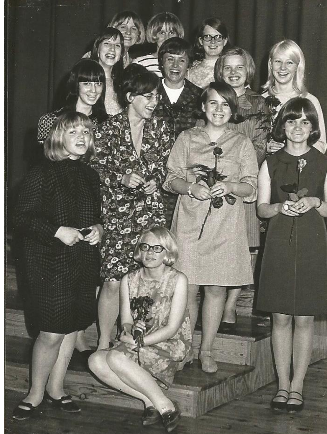
Kuva: Iisalmen tyttölyseon teinikunta, 1967.