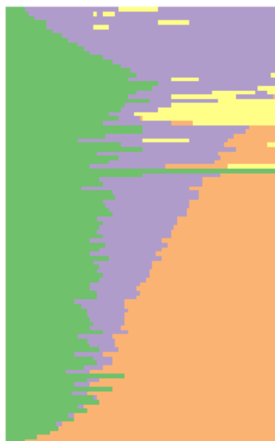
Kuvio 1. Lapsettomien ja lapsia saaneiden liittopolkuja ikävälillä 18–39. Lapsettomilla tarkoitetaan tässä henkilöitä, joilla ei 42 vuoden iässä ollut biologista lasta. X-akselilla on ikä.