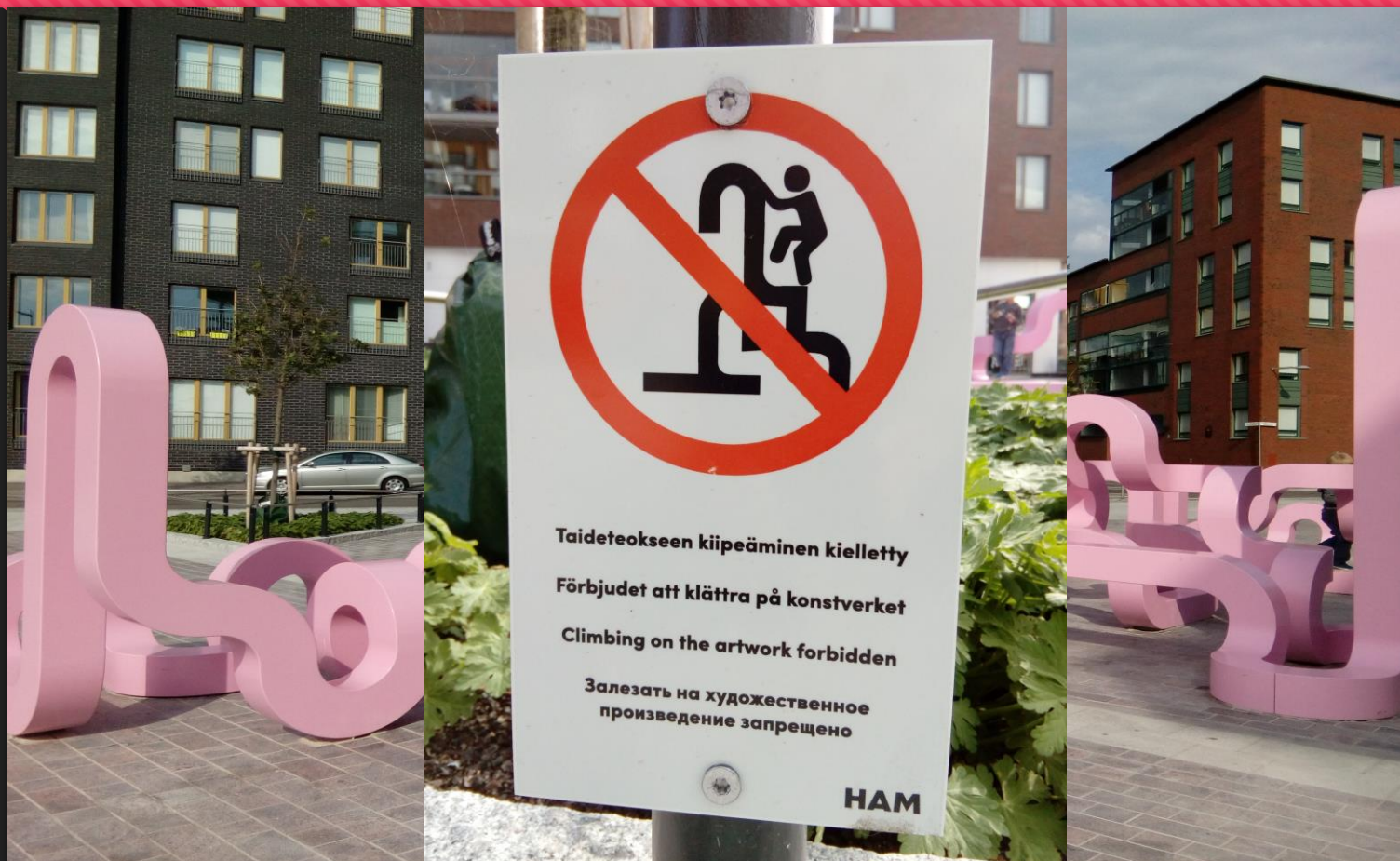
Early One Morning, Eternity Sculpture